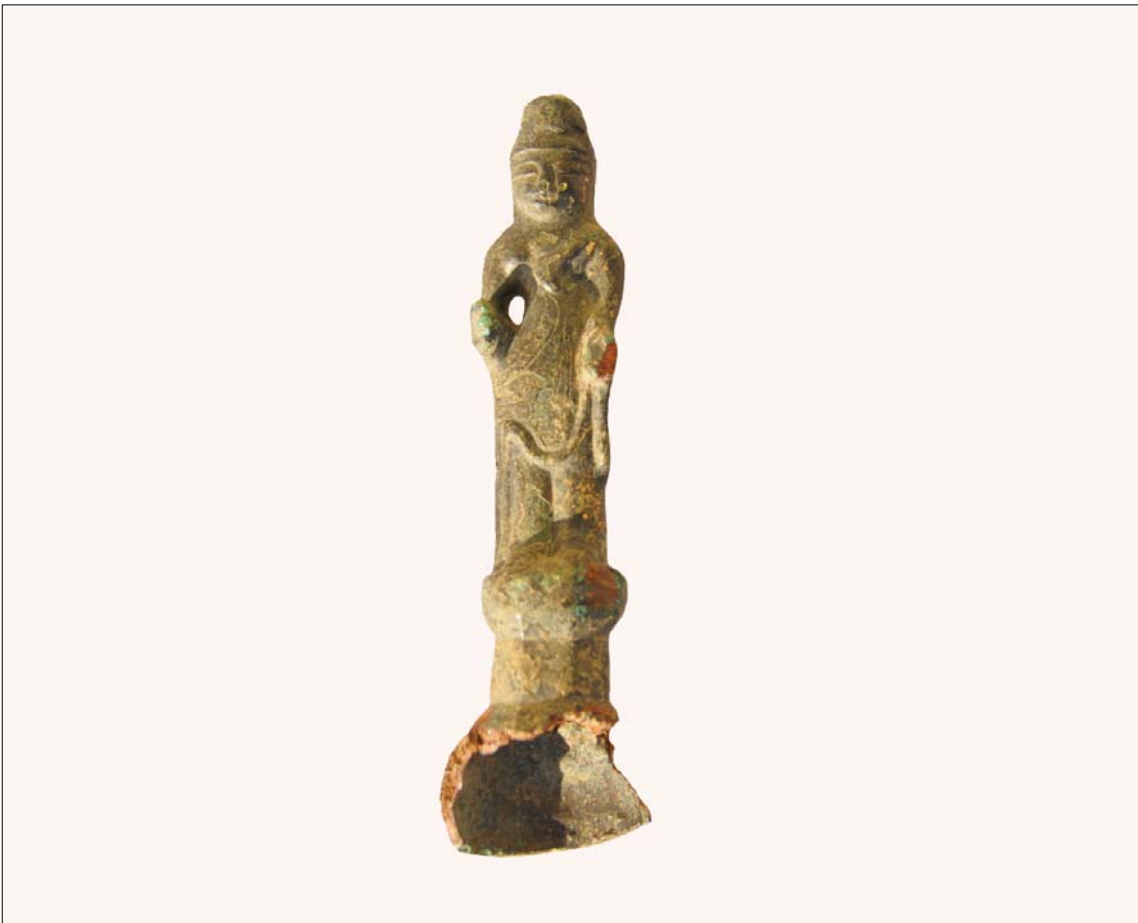
8차 발굴조사 라구역 건물지 31호 출토 소형금동불입상