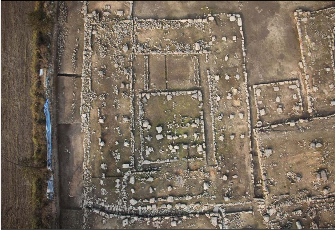
8차 발굴조사 나구역 전경