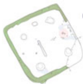
마한 · 백제 사주식 주거지의 의미와 과제